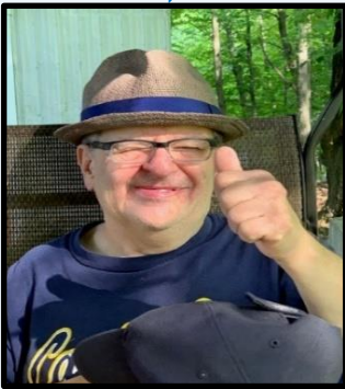
Personne accueillie au Foyer L'Éclaircie

Il est maintenant temps de se serrer un peu les coudes le temps que le cycle de renouvellement d'assistants se complète; d'ici là, nous sommes à la recherche de bénévoles pour venir partager avec nous des soirées et des fins de semaine dans nos résidences afin d'offrir des temps de repos à ceux qui y sont en permanence. Et espérons bientôt l'arrivée de nouveaux assistants... Qui verra verra !